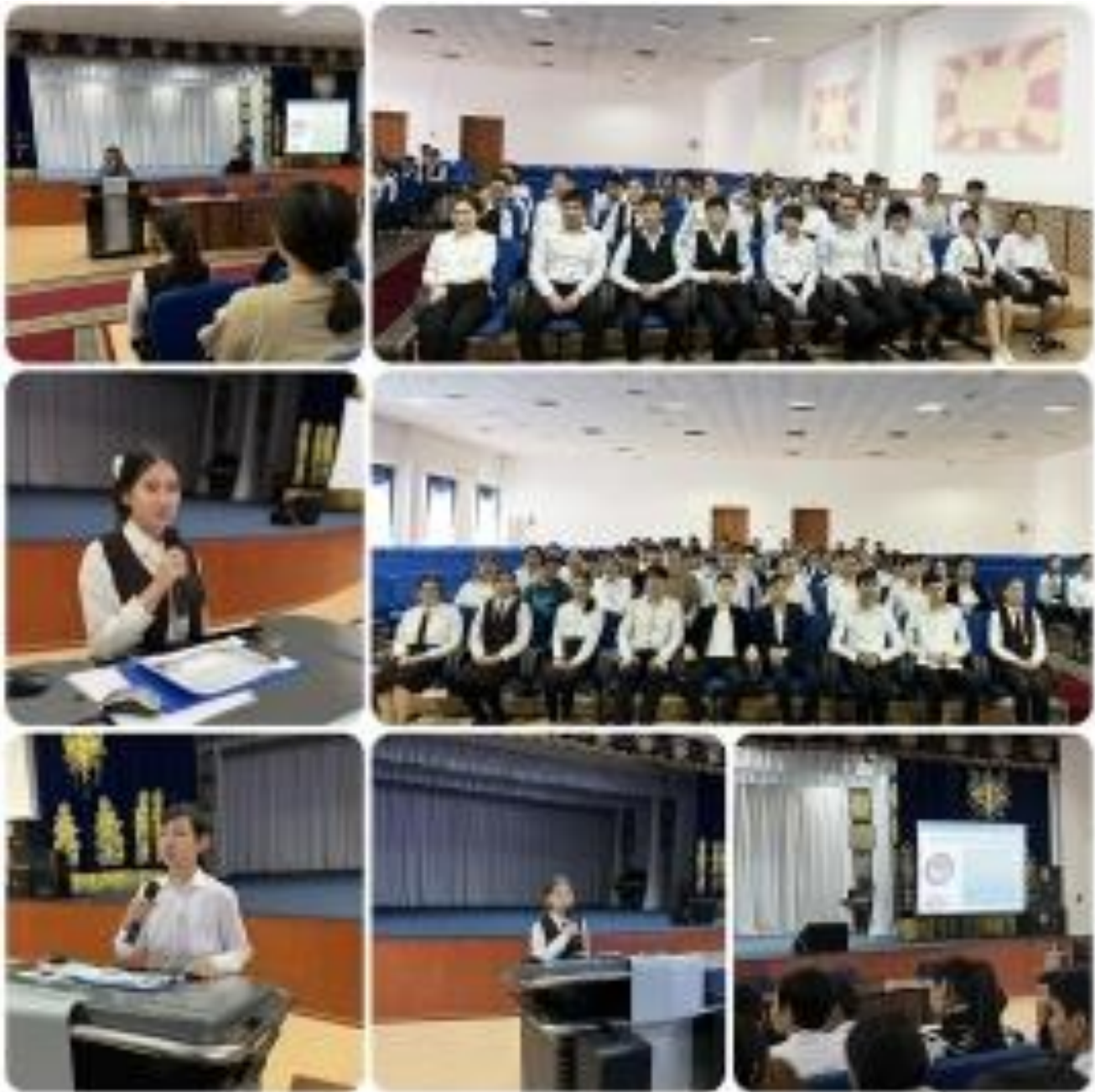
28.11.2023 жылы мектеп ұстаздарымен Қазақстан Республикасының сыбайлас жемқорлыққа қарсы саясатының 2022-2026 жылдарға арналған тұжырымдамасы талданды