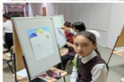
«АДАЛДЫҚ – АРДЫҢ ІСІ» СУРЕТ САЛУ ШАРАСЫ